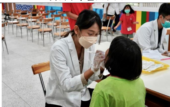
幫國小學童口腔檢查