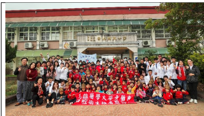
與國小學童大合照