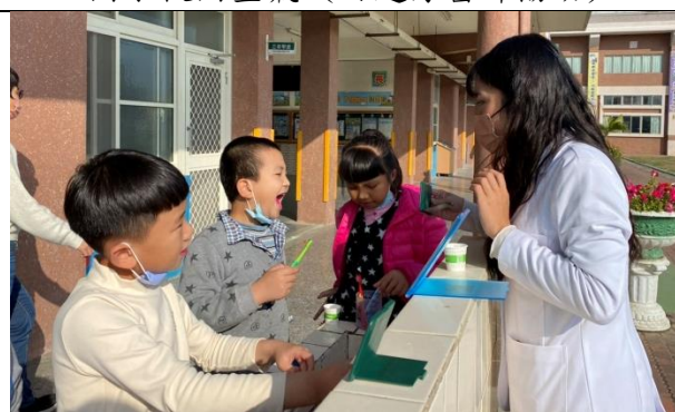
刷牙實作教學 (搭配牙菌斑顯示器)