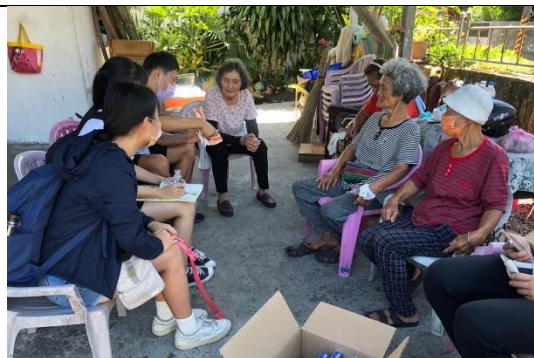
家訪陪長輩聊聊天