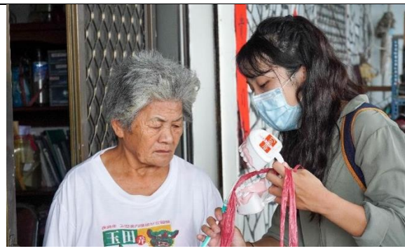
家訪跟居民說明口腔保健知識