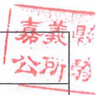
嘉義縣義竹鄉生育補助發放自治條例修正草案條文對照表