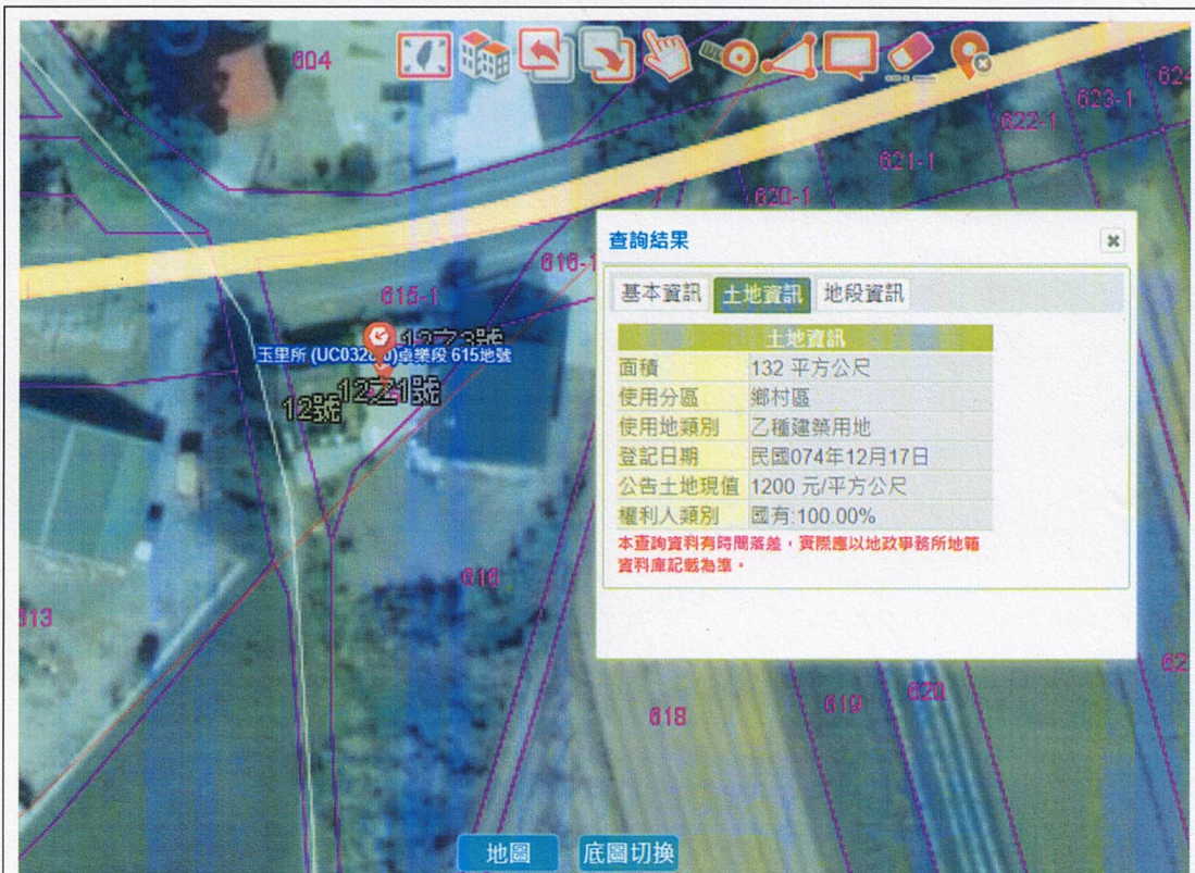
花蓮縣卓溪鄉卓樂段 615 地號