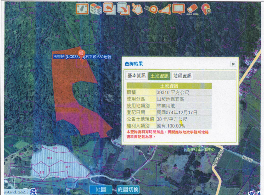
花蓮縣卓溪鄉石平段 680 地號