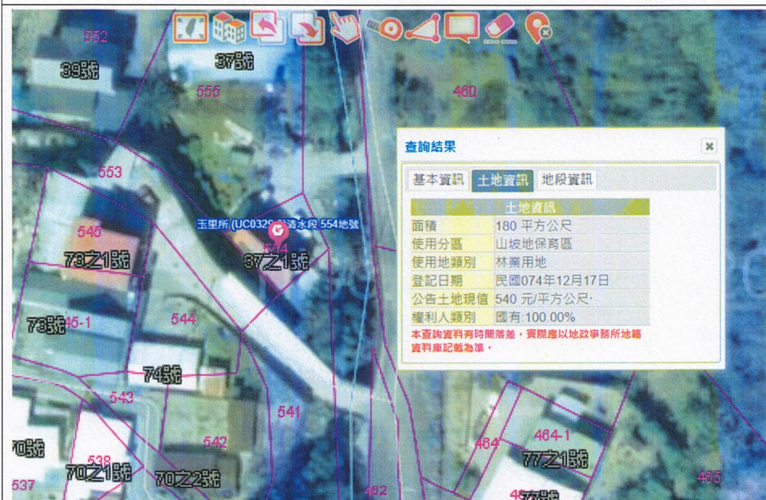
花蓮縣卓溪鄉清水段 554 地號