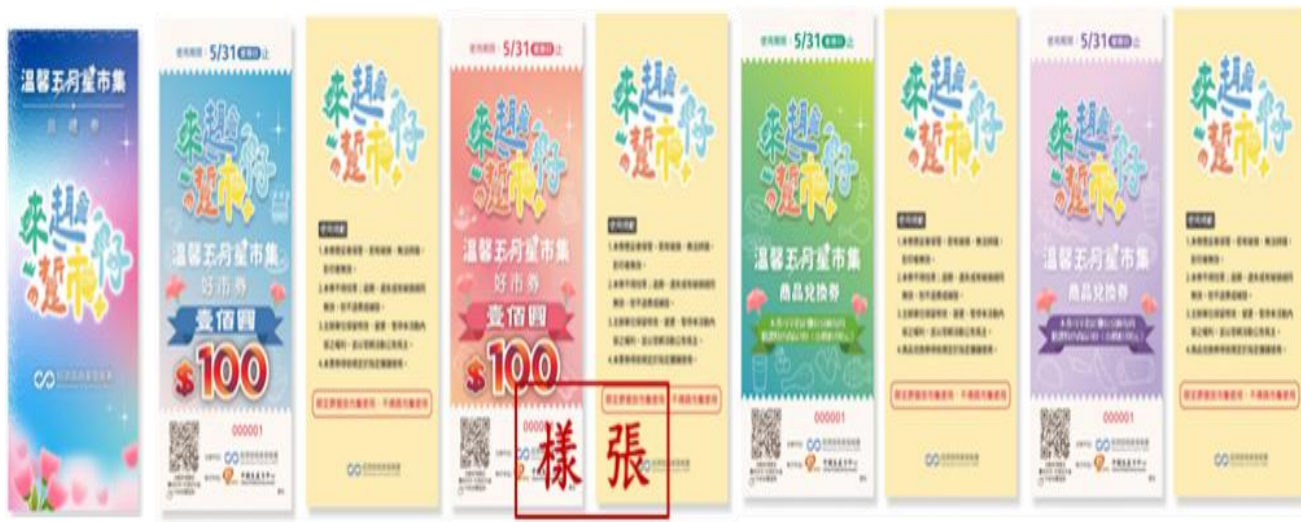
【來趣·逛市仔 | 溫馨五月·星市集】套票-設計圖

活動期間民眾前往指定市集，並自備環保購物袋、環保杯或環保餐具（含餐盒、餐具組等）任一項，至市集服務台出示並經現場工作人員確認後，即可以新臺幣200元現金兌換價值400元的「來趣·逛市仔 | 溫馨五月·星市集」套票1份（每人每次限兌換1份）；每週數量有限，兌換完畢為止。