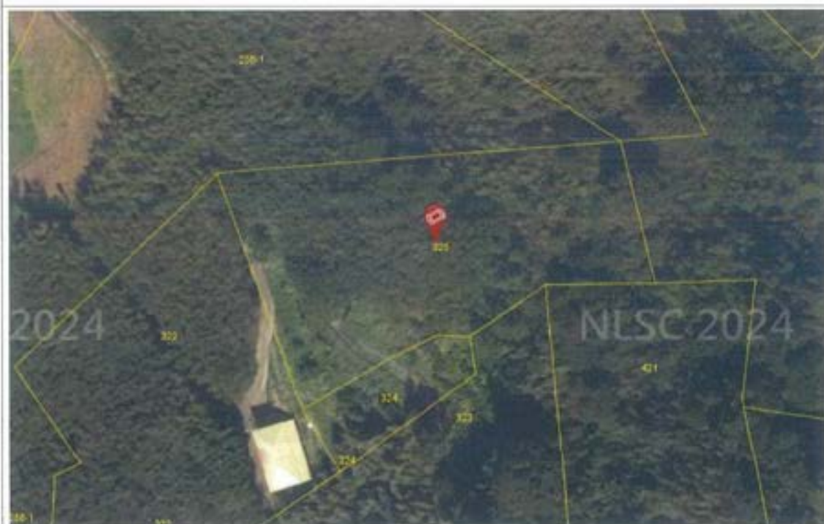
(四)清安段 325 地號