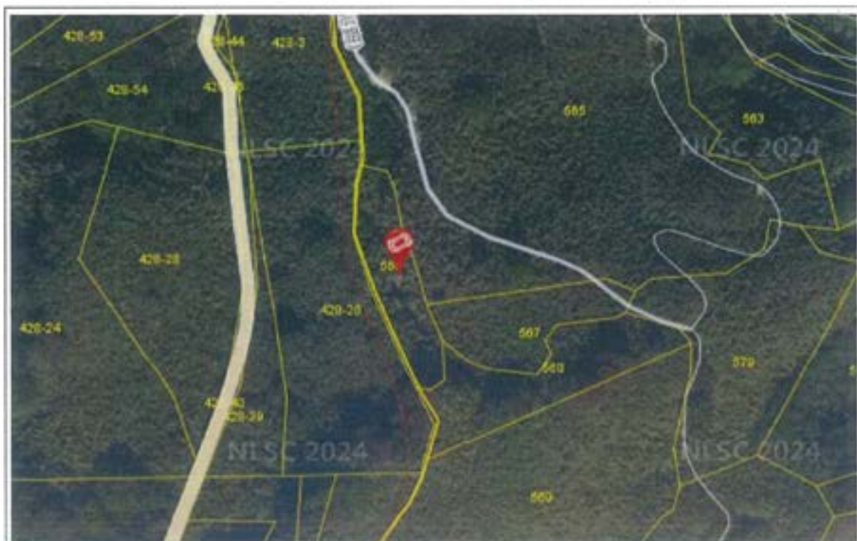
(三)八卦力段 566 地號