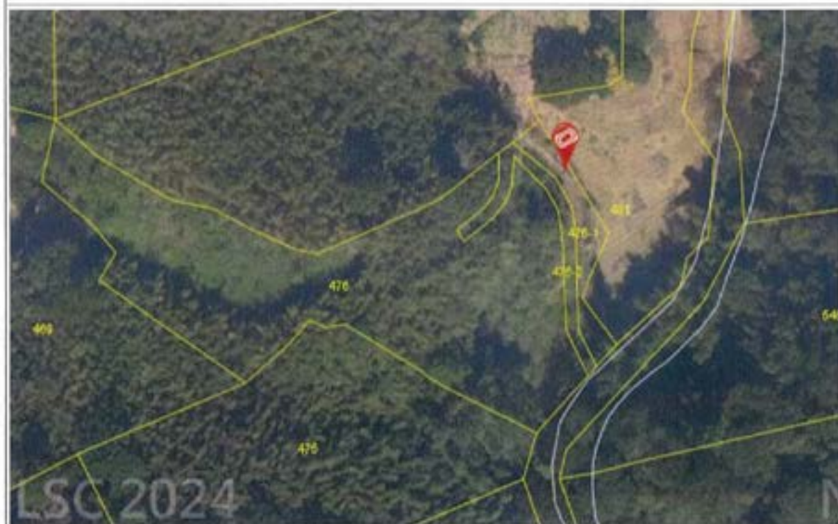
(二)八卦力段 476-1 地號